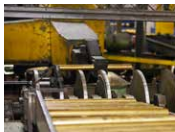
Barres en bronze coupées selon la longueur désirée