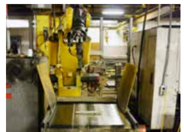
Les tiges et les collets de butée sont usinés et machinés par des automates