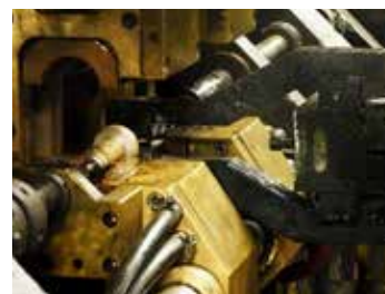
La tige est chauffée électriquement puis poussée afin de créer le collet de butée