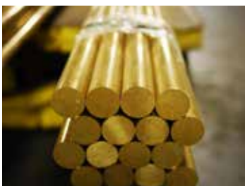
Barres en bronze